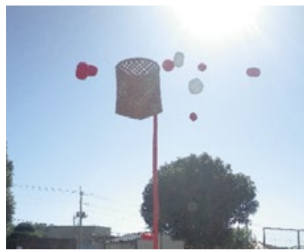
青空の下での玉入れ