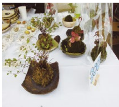
コケ玉の販売風景

特にクローバーによるかぼちゃ饅頭・プリンはリピーター様も多く、売れ行きも非常に好調でした。