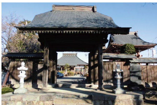
社会福祉法人広済会の前身 善龍寺の正門

新年あけましておめでとう ございます。平素より皆様の 当法人へのご理解・ご支援に 深く感謝申し上げます。 さて、平成28年に社会福祉 法が改正され当法人では組織 改革、職員の意識改革、利用 者支援の質の向上に職員全員 で取り組んでまいりました。 平成から年号が改まる今年 は、その成果の充実と持続、